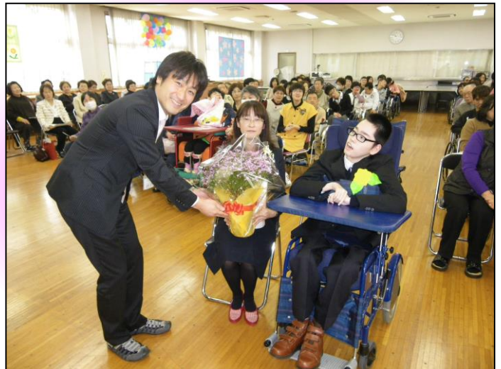
↓ 新利用者迎える会。緊張のいずみ園生活のスタート？