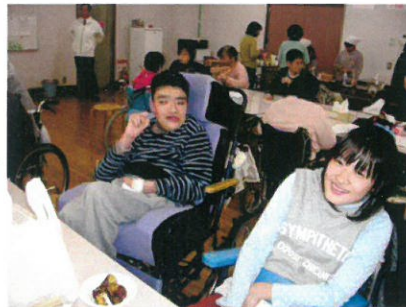
→次は何を食べようかな？と考えている利用者さん。