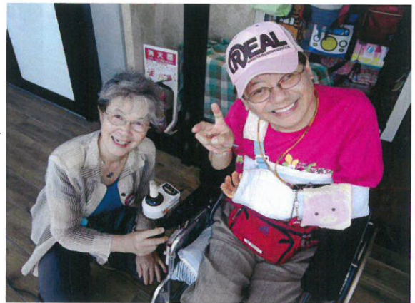
→ ボランティアさんと帰り際に1枚。

まるで小さな街のような店内に入ってみると、和洋さまざまな料理や心揺さぶられる色々なお店に皆さんも悩みに悩み、「何を食べようか」「何を買おうか」考えていました。ご飯を食べたり、買い物したりお茶をしたり各々楽しいひと時を過ごされたのではないのでしょうか。帰りのバス車内では行き以上に会話も弾んでいました。