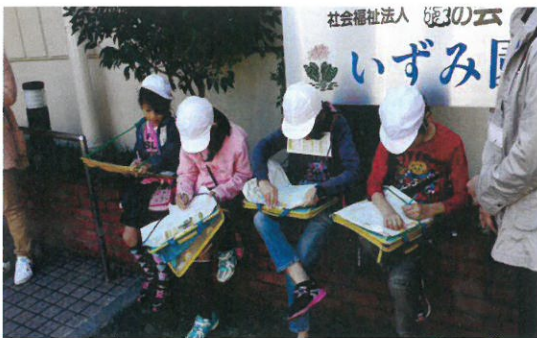
見学しての感想を書いています

一〇月二十九日(水) 逆井小学校の二年生グループが、「まち探検」でいずみ園にやってきて施設見学、質疑応答を行いました。いずみ園祭ではたくさんの逆井小学校の皆さんがやってきましたが、普段は中々交流する事が出来ず、今回のまち探検はお互いを知る良い機会になったのではないのでしょうか。