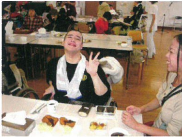
←利用者さん、沢山食べて満腹です。