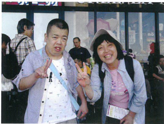
← ボランティアさんと一緒に に沢山買い物できました。