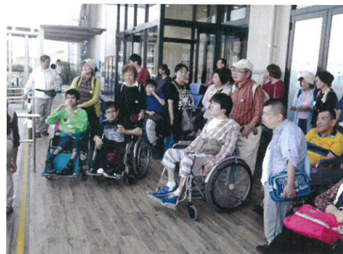
← さあ、これから帰ります！