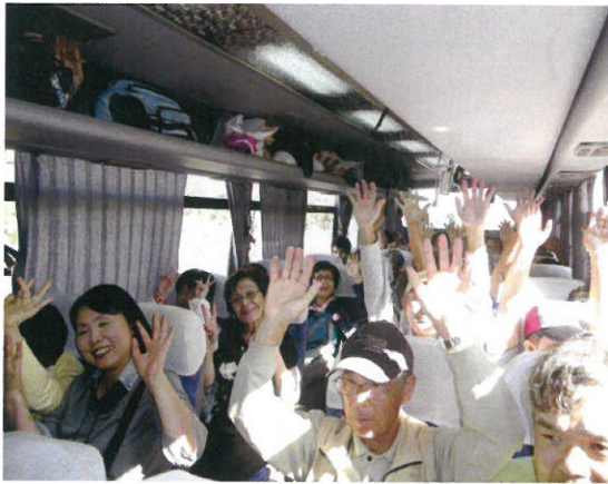
← 待ちに待った遠足！ 出発〜！

九月二十九日、気持ちの良い青空のもと、秋の爽やかな風を感じながら遠足に行ってきました。今回は・・・昨年末にオープンしたばかりの『イオンモール幕張新都心』へバスで出発！！バス車内ではボランティアさん、職員、利用者さんが会話で盛り上がり、あつという間に目的地に到着。想像以上の大きさにびっくり！！