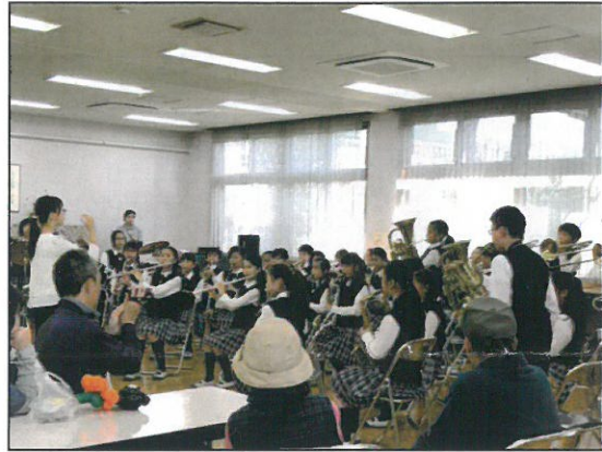
↑逆井小プラスバンド。迫力の生のサウンドでした！