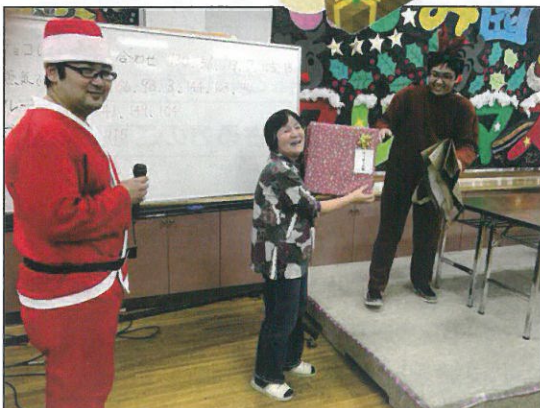
←プレゼント抽選会。一等賞は利用者の保護者さんでした。おめでとうございます！

そしてクリスマスプレゼントは抽選方式。当たらない人もいましたが、抽選であるならばプレゼントは豪華なもの。こちらは大いに盛り上がりました。