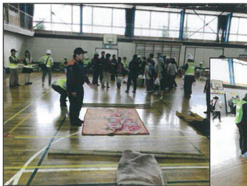
↑毛布と竹で即席担架づくりを消防署員さんの指導を受けています。