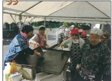
↑保護者有志の作る焼きそばは美味しくて有名。