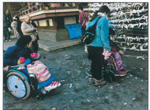
↑吉のおみくじは持ち帰りたいのですが・・・、やむなく結び付けました。