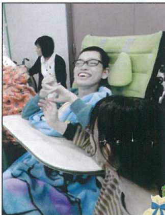
←利用者さん、最高の笑顔を見せてくれます