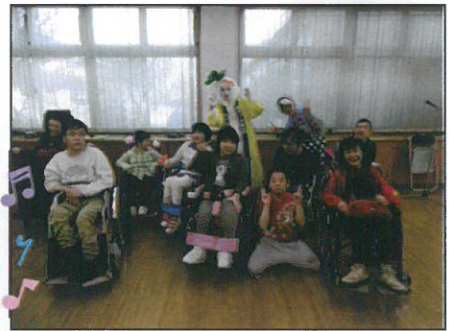
↑カブ座衛門！ 柏の誇るべきキャラクターと。記念撮影。