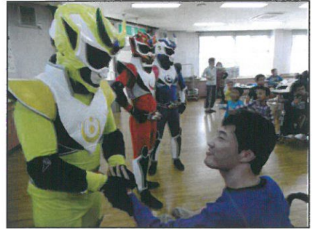
↑テガレンジャーが初登場！ 握手会です。

地域で活躍されている歌手や人気キャラクター、またいずみ園スタッフも変装して登場したり、利用者さんも興味津々で参加されました。