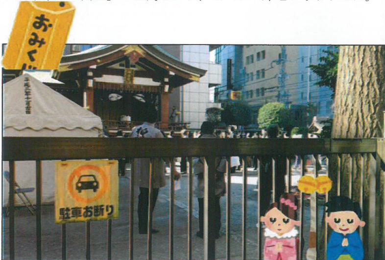
↑柏神社境内では獅子舞が出てきたり、雅楽があつたりして、お正月らしく賑やかでした。