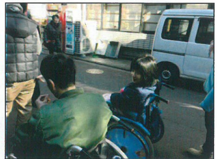
↑並ぶのも経験ですね。暖かくて良かったです。