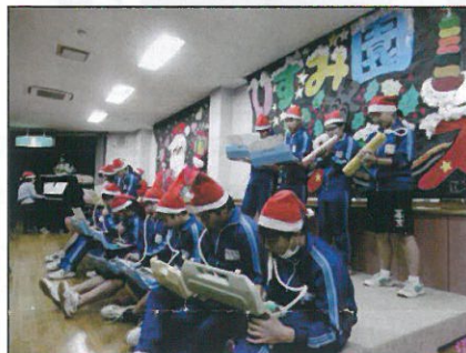
↑逆井中学校の皆さんも演奏の練習の成果を発揮してくれました。