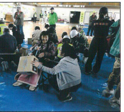
←そろそろ訓練が始まります。