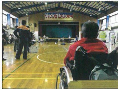
↑まずは見学と顔つなぎ。