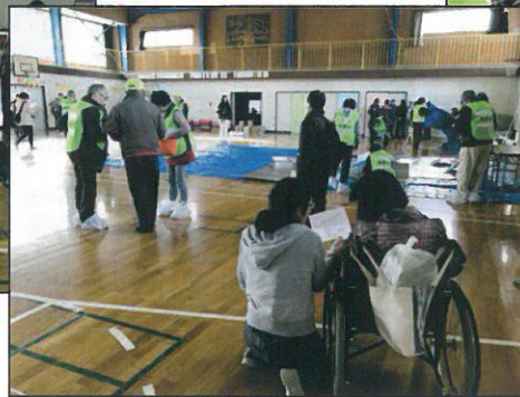
→段ボールとビニールとスズランテープで水汲みバケツを作成しました！