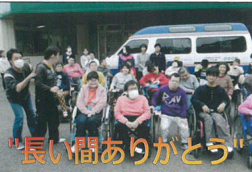
"長い間ありがとう"

が、14年間の利用者送迎の役割を終えました。雨の日も風の日も、頑張って活躍してくれました。ありがとうございました！